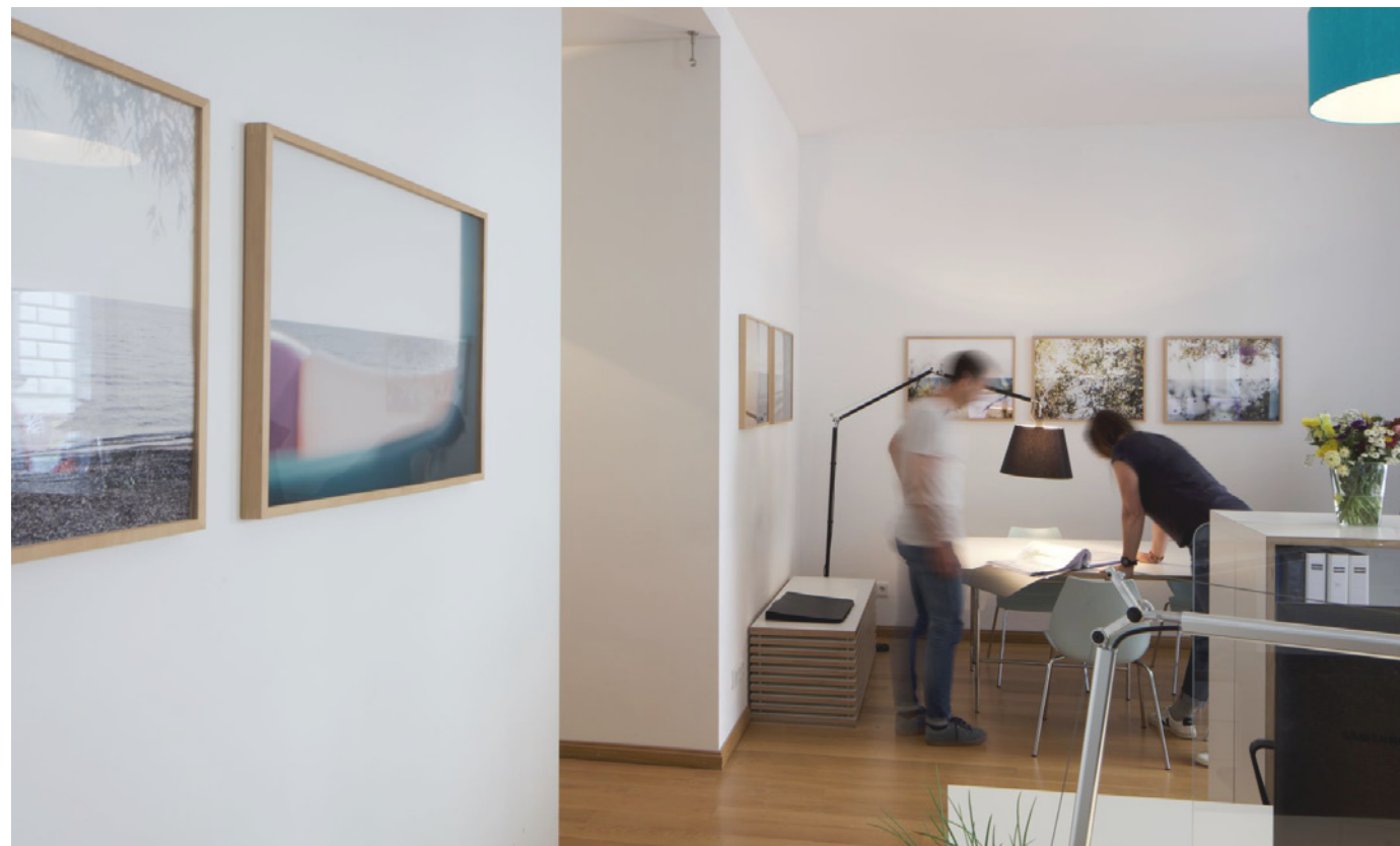
Eingangsbereich Ladenbüro mit Dauerausstellung „Roberto Simoni“