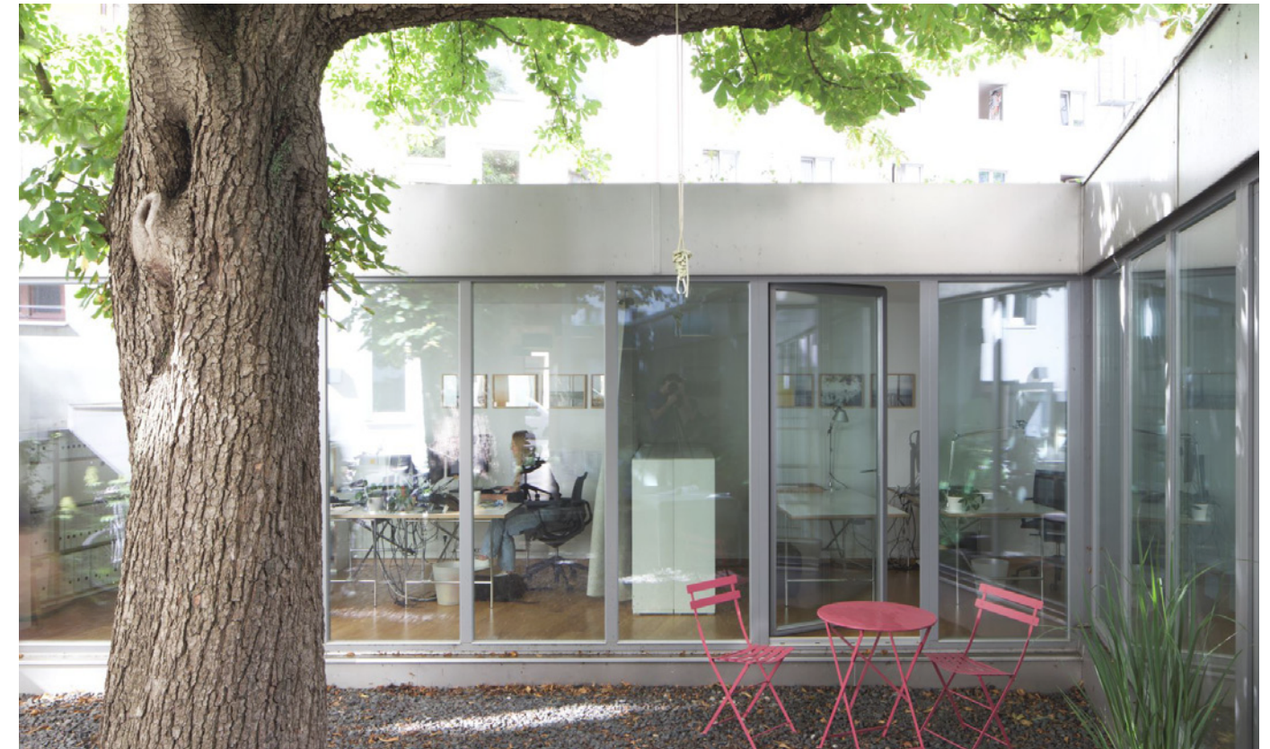
Blick in den Innenhof mit 90 Jahre alter Kastanie