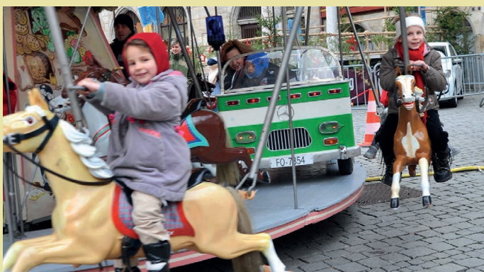
Während die Eltern gemütlich einen Weihnachtspunsch genießen, haben die Kinder die Möglichkeit, direkt am Rathausplatz eine Runde Karussell zu fahren.