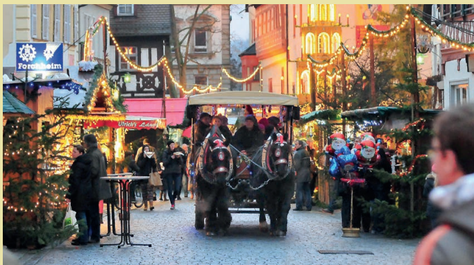
Kutschfahrten durch die weihnachtlich geschmückte Forchheimer Altstadt.