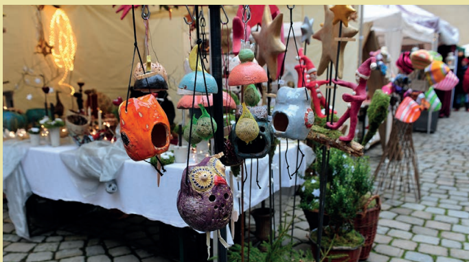
Am zweiten Adventswochenende werden Werke von Hobby-Künstlern im Kaiserpfalz Innenhof angeboten.